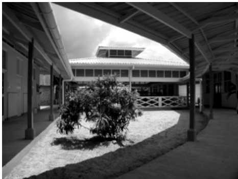
Een foto van het nieuwe project voor kinderen met een verstandelijke handicap

Nadat mijn werkzaamheden in Nederland afgerond waren ben ik vertrokken. Na 1 dag Paramaribo op naar mijn nieuwe huis aan de Gemaalweg in de Clarapolder. Van daaruit zou ik beginnen met een eenvoudig wijk- en buurtcentrum op te zetten. Dank zij de hulp van de Stichting Vrienden van Nickerie en de Stichting Perspektief kon ik wat boeken en computers krijgen. Tot mijn verbazing groeide het centrum uit tot een echt wijk- en buurtcentrum met vele