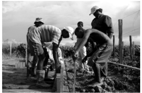
leer- en werkproject voor randgroep jongeren

Mijn gastheer reed wat op en neer door de rechte, uitgestorven straten van Nickerie. We waren wat aan het wandelen vertelde hij en we waren bijna de enige. Na een uurtje werd ik afgezet bij het hotel waar iedereen al in diepe slaap gewikkeld was en er geen djogo meer te krijgen was.