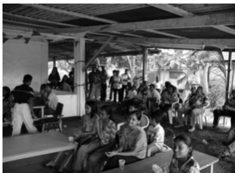
buurtmensen van de Clarapolder bij het wijk- buurtcentrum OCON op de Gemaalweg

Nog steeds moeten veel studenten boeken kopiëren tegen hoge commerciële kopieerkosten. Ook blijkt er nog steeds een grote behoefte te zijn aan computers op de verschillende scholen; de VVN wil ook hier een bijdrage aan leveren. Veel verzoeken uit de polders hebben te maken met cybercafés; VVN zou graag in de Corantijnpolder, in Paradise en Henar cybercafés openen. Hierdoor komt de digitale snelweg ook beschikbaar voor die jongeren en met name de meisjes uit de polders. Midden in het centrum van Nickerie ligt een veld dat gebruikt wordt voor diverse sportevenementen. Wat hier ontbreekt is een (half)open zaal waar voornamelijk vrouwen en meisjes veilig kunnen bewegen. Een zaal die daarnaast ook gebruikt zou kunnen worden voor trouwerijen, voorlichtingsbijeenkomsten e.d.